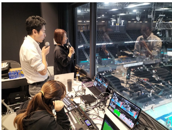
大会期間中の配信・実況の様子