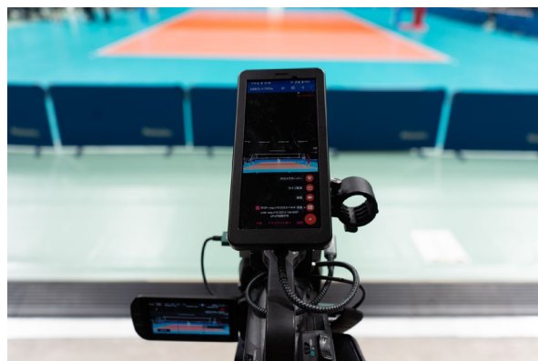
ローカル 5G 端末と接続された 近接映像カメラ