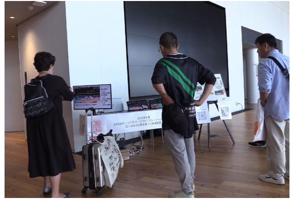
SAGA アリーナ内での配信事業説明