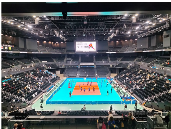
大会期間中の SAGA アリーナの様子

ローカル5Gで配信した映像・音声を実況とテロップを加えて、付加価値の高い映像を配信しました。また、SAGAアリーナにお越しいただいた方のスマートフォン・タブレット端末等から無料視聴ができ、競技フロアの選手に近い目線での高精細・低遅延で臨場感のある映像と、スタンドからの競技観戦を同時に楽しめる新しい応援スタイルを提供しました。また、来場者の方にローカル5Gの技術紹介も行い、体感いただくことで、ローカル5Gへの理解も深めていただきました。