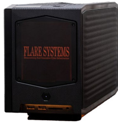
本事業にて採用したフレアシステムズ社 オールインワン・コア一体型ローカル 5G システム