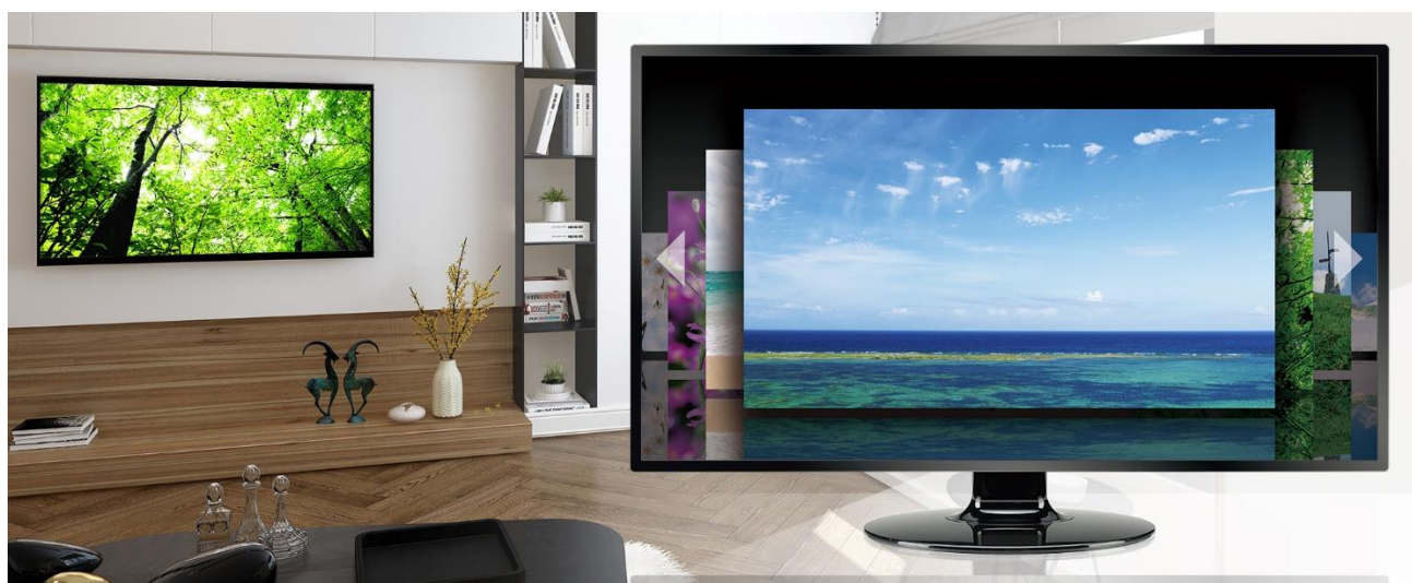
本サービス使用時の空間イメージ

凸版印刷が 2015 年より提供しているオリジナル高品質 4K 映像コンテンツと、ブロードバンドタワーの 5G に対応したデータセンターを核とする幅広い IT 技術、並びにケーブルキャストの有する全国規模の情報配信ネットワークを活かした日本全国のケーブルテレビ局へのリーチ力を組み合わせ、超高精細・高品質 4K 映像を家庭用 4K 対応テレビへ配信するサービスの提供を目指します。3 社は本実証にあたって、ケーブルテレビコミュニティチャンネルの 4K ハイブリッドキャスト(※1)上でのビデオ・オン・デマンド配信を想定し、検証を実施します。